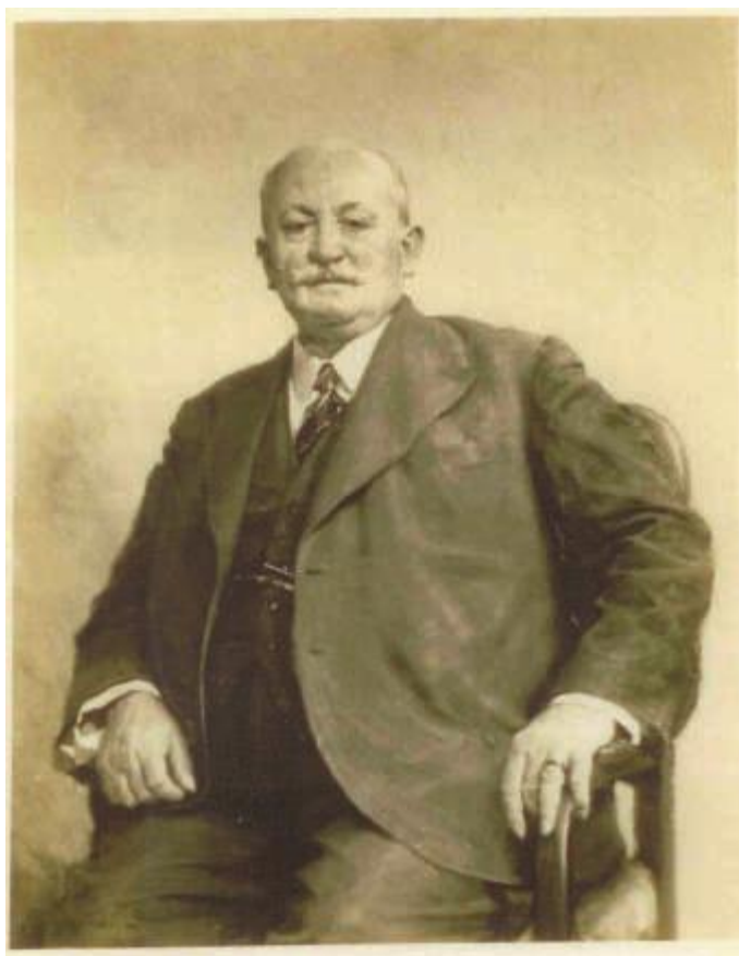
Profesor Roman Rencki po przejściu na emeryturę i krótko przed jego egzekucją.